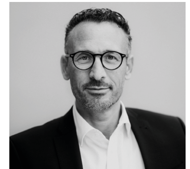
Giocchino Calà Beratung & Vermittlung