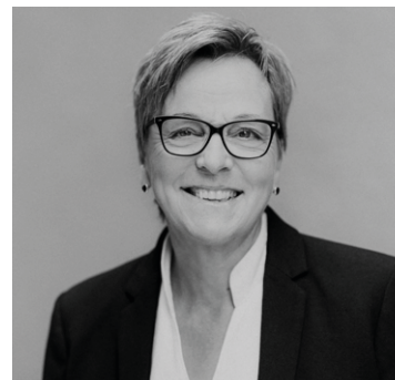
Marie-Louise Grand Beratung & Vermittlung