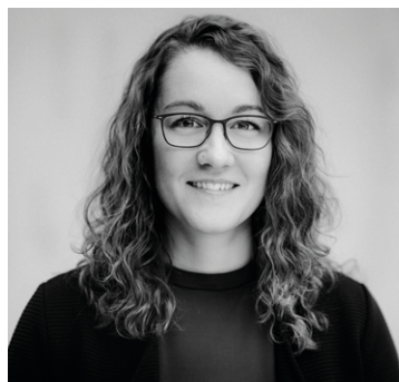
Bettina Häfliger Fotografie, Grafik, Marketing