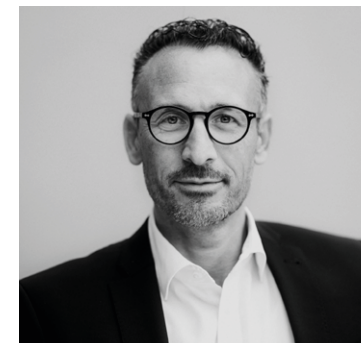
Gioacchino Calà Beratung & Vermittlung